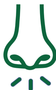
Naso che cola