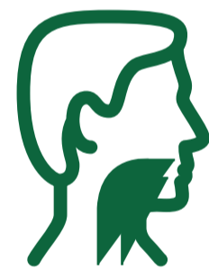
Mal di gola